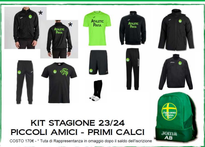
KIT STAGIONE 23/24 PICCOLI AMICI - PRIMI CALCI

Il Kit, Materiale Tecnico è obbligatorio acquistarlo all'atto della prima iscrizione. Gli anni successivi è sufficiente il reintegro dei capi rovinati, smarriti o misura della taglia non più adeguata.