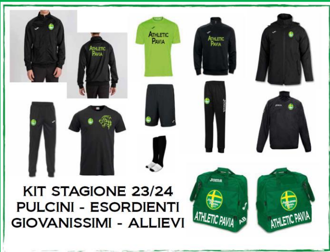
KIT STAGIONE 23/24 PULCINI - ESORDIENTI GIOVANISSIMI - ALLIEVI

* la Tuta di Rappresentanza è in omaggio dopo il saldo dell'iscrizione