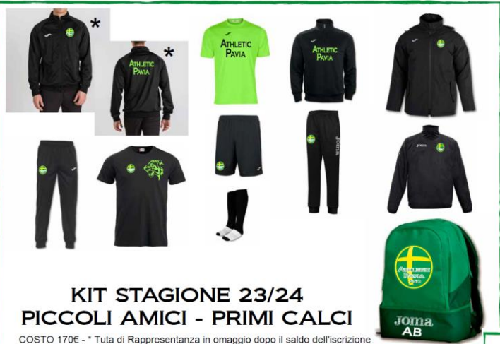
KIT STAGIONE 23/24 PICCOLI AMICI - PRIMI CALCI

Il Kit, Materiale Tecnico è obbligatorio acquistarlo all'atto della prima iscrizione. Gli anni successivi è sufficiente il reintegro dei capi rovinati, smarriti o misura della taglia non più adeguata.