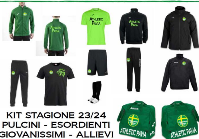
KIT STAGIONE 23/24 PULCINI - ESORDIENTI GIOVANISSIMI - ALLIEVI